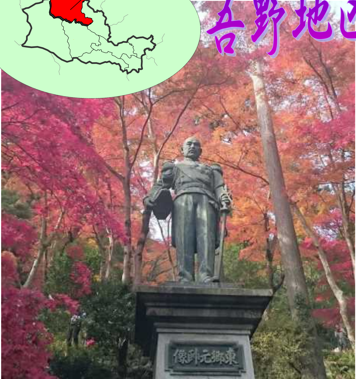
紅葉の名所 東郷公園

吾野地区は、飯能市内の北西に位置し、豊かな森林と清流「高麗川」を源流とした恵まれた自然環境の中に歴史と文化が息づくまちである。