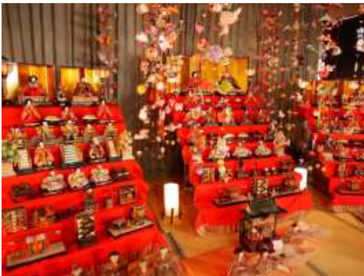
旧南川小のひな祭り