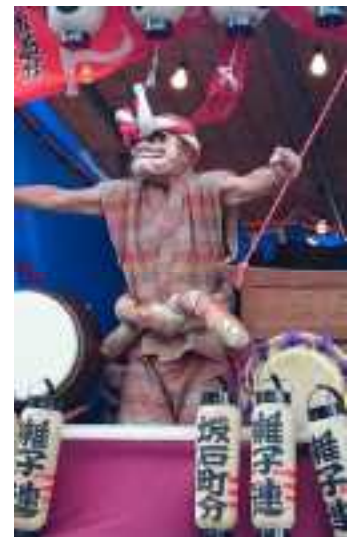
坂石町分のお囃子