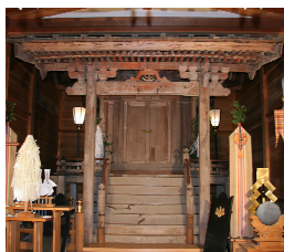
唐竹白鬚神社（県指定）