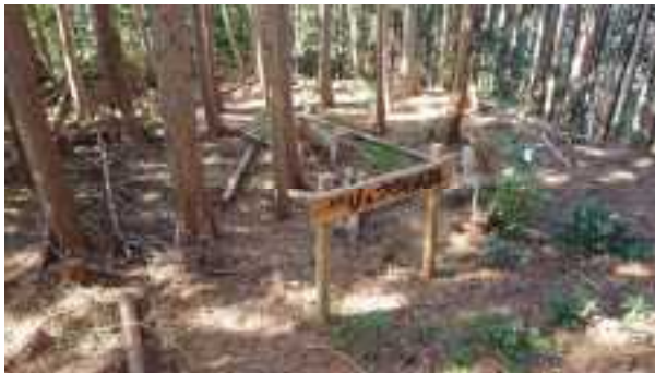
四季を感じる歩こう会で整備したリュウガイ城址