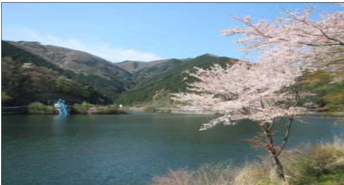
名栗湖畔より棒ノ嶺方面を望む