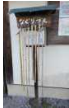
なぐり杖設置場所