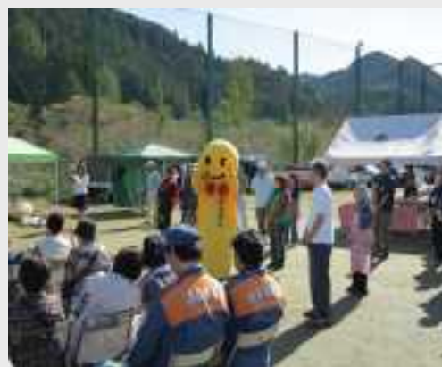
名栗ふるさとまつりの様子