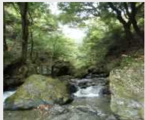
ホタルが飛び交う名栗の清流