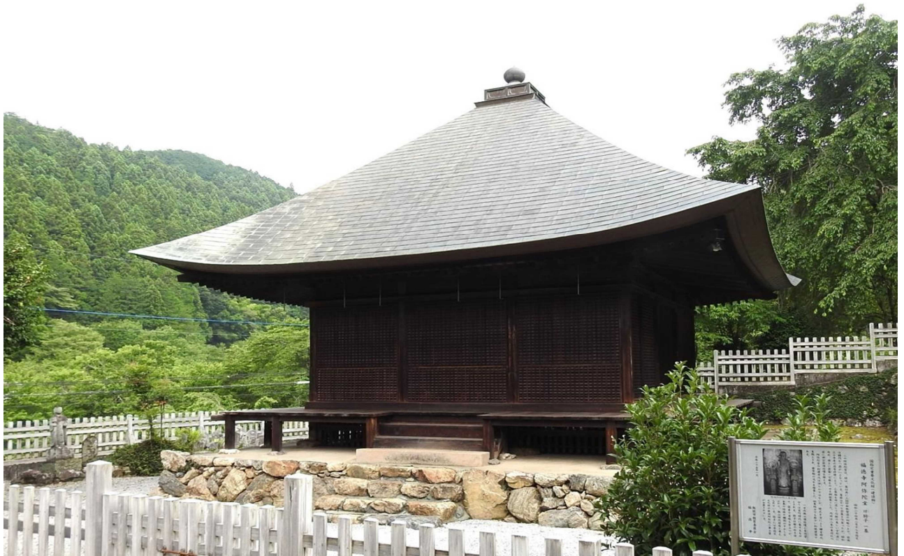
国指定重要文化財 福徳寺阿弥陀堂

東吾野地区は、飯能市の北部に位置しており、杉、檜の美林と高麗川の清流、「ほたる」の飛び交う支流もあり、恵まれた自然環境の中に位置し、歴史文化遺産も多々ある。また、近年トレイルランやハイキングで訪れる人も多い風景の美しい郷である。