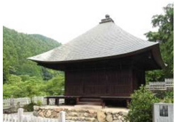
福德寺阿弥陀堂 国指定重要文化財