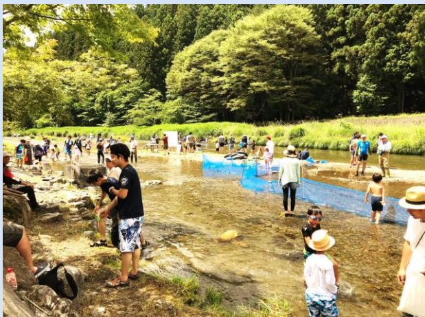
△多くの親子で賑わいました。毎年キャンセル待ちが出るほど大人気！

7月1日（日）に名栗河川広場で行われた川遊びイベント。豊島区を中心に215人の親子が路線バスを使って来訪し、マスのつかみ取り、タイヤチューブで川下りなど都会では味わえない体験で名栗の自然を満喫しました。また、会場ではマスの塩焼きやふかしジャガイモも振る舞われ、親子の笑顔が溢れました。主催の「わくわく名栗クラブ」は、平成24年の国際興業バス撤退問題を機に地元の人たちの協力で立ち上がった団体です。このイベントだけでなく様々な試みで名栗地区への誘客を仕掛けます。