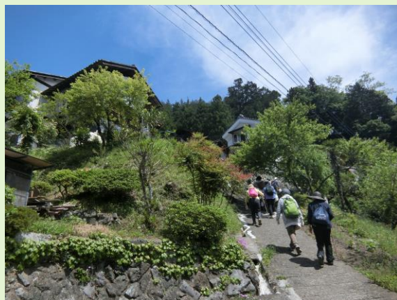
△山間にある民家を訪ね歩きます。地元の方のおもてなしも好評！

5月6日（日）に南高麗・細田地区で開催された春のお散歩マーケット。今回で27回目を数え、今や飯能市のエコツーリズムの代名詞ともいえるイベントです。人気の秘訣は、豊かな自然と独特な地形を有する細田地区を練り歩く爽快感と、地元の人たちのバリエーション豊かな手作り品の数々。今年は昨年より143人多い、1,239人もの方にご来場いただき、国際興業バス間野黒指線も多く臨時便運行で対応いただきました。