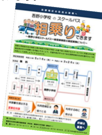
△周知用リーフレット