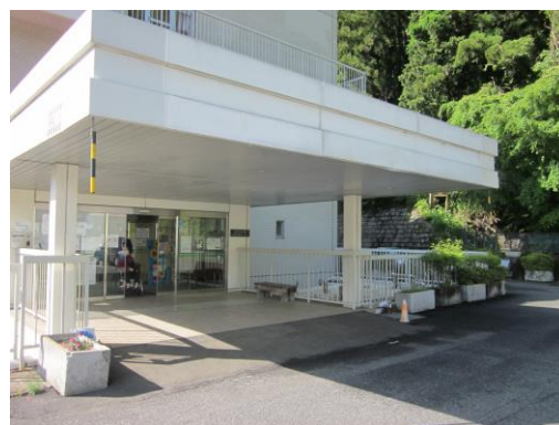
△東吾野医療介護センター 停留地点

今回の混乗制度では、今までのスクールバスの停留地点のほか「吾野駅（法光寺駐車場）」と「東吾野医療介護センター」の2か所を停留地点として設けています。これは昨年度の市民アンケートの結果、吾野地区の方の利用が多い公共施設を設定しています。運行業務を担当している国際興業バスほか、多くの関係者のご協力で設置が実現しました。