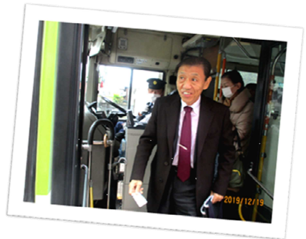
△大久保市長、路線バスを使って登庁