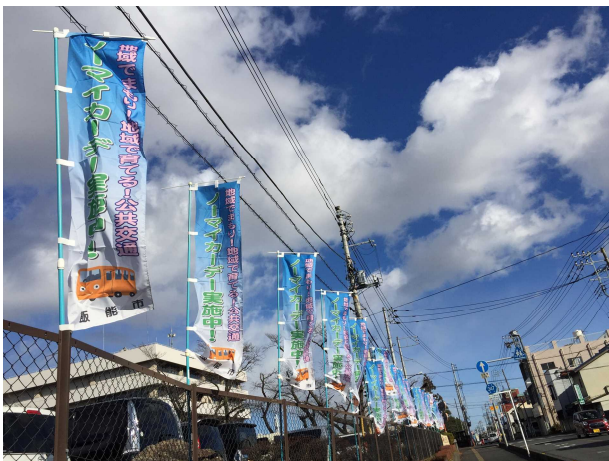
△飯能市役所本庁舎前にのぼり掲出