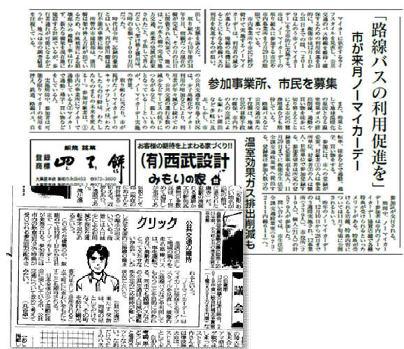
△埼玉新聞、文化新聞に記事掲載