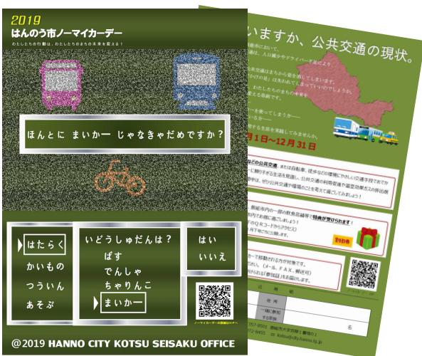
△市内施設、国際興業バス車内等でチラシによる周知