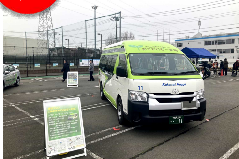
△2/25 国際興業バスまつり 2024 春 in 飯能に出展

これまでの利用状況や乗込調査の結果、利用者や地域の皆さんからのご意見などを踏まえ、今年10月1日から飯能市乗合ワゴン「おでかけむーま号」の運行内容を見直します。今回は、見直し後の運行内容についてお届けします。各調査や地区での検討会にご協力いただきました皆さん、ありがとうございました。今後も積極的にワゴン使ってください、これからも運行が続くよう、みんなで応援していきましょう。