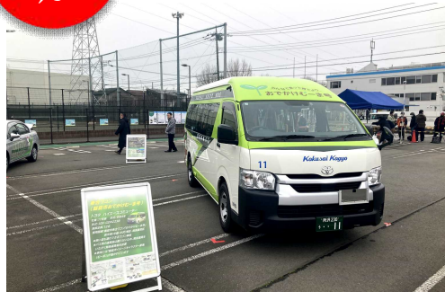
△2/25 国際興業バスまつり 2024 春 in 飯能に出展

これまでの利用状況や乗込調査の結果、利用者や地域の皆さんからのご意見などを踏まえ、今年10月1日から飯能市乗合ワゴン「おでかけむーま号」の運行内容を見直します。今回は、見直し後の運行内容についてお届けします。各調査や地区での検討会にご協力いただきました皆さん、ありがとうございました。今後も積極的にワゴン使ってください、これからも運行が続くよう、みんなで応援していきましょう。