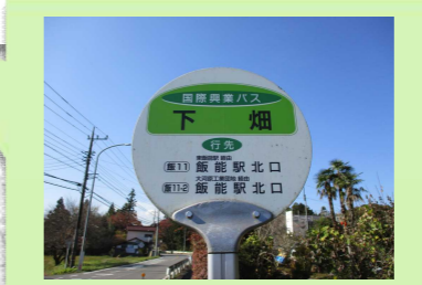
停留所は今までどおり 国際興業バスの停留所です