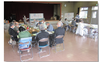
△加治東地区 第2回検討会(10/16)の様子