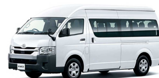
▲外観イメージ（ラッピングデザイン検討中）