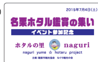
*プラスチックカード図

なお、国際興業バスを利用してご来場されたお客様に「名栗ホテル観賞の集い」限定「ヤマノススメプラスチックカード」を差し上げます。（先着200名）