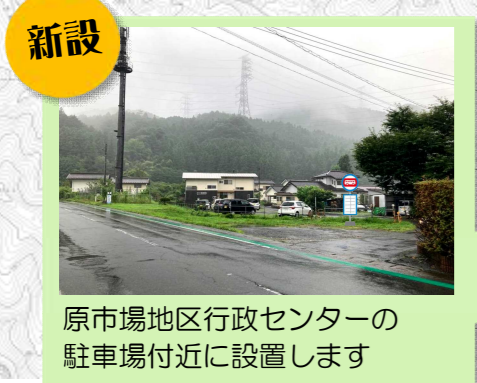
原市場地区行政センターの 駐車場付近に設置します