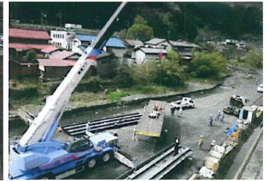
老朽化した橋の架け替え