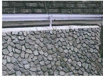
河川の護岸を補強する工事