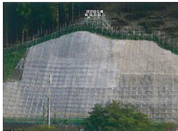
西武鉄道の修繕工事