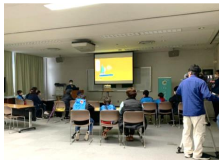
SDGs こどもエネルギー教室