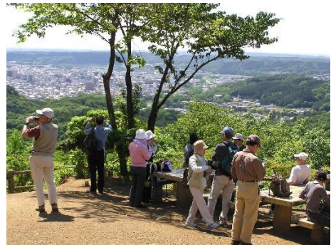
ふる里散歩（多峯主山山頂にて）