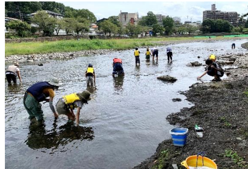
飯能河原ではじめての川釣り体験