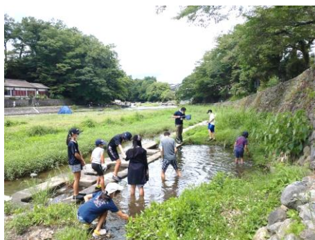
飯能河原水質調査