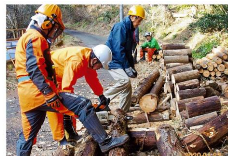
間伐材の搬出（玉切り）