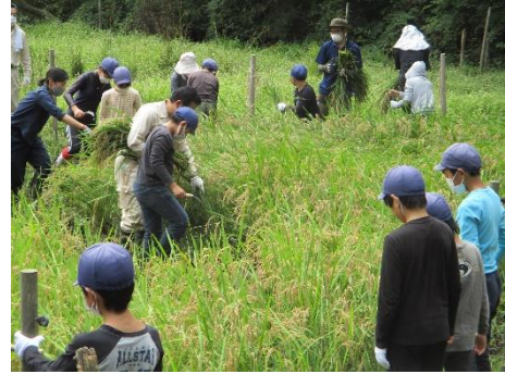
天覧山谷津の里づくりプロジェクト