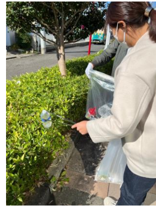
マナーアップキャンペーン