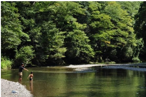
飯能河原周辺河岸緑地