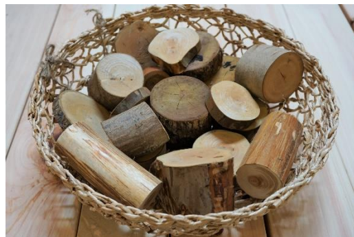
西川材を用いた木育イベント