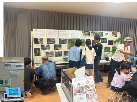
◀左：開会式 中：ワークショップ 右：展示の様子