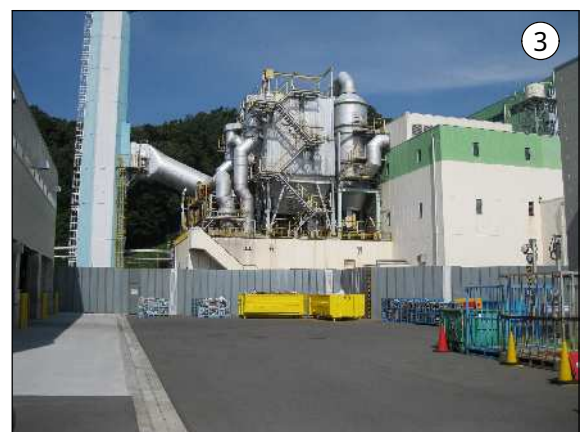
仮囲いの設置状況