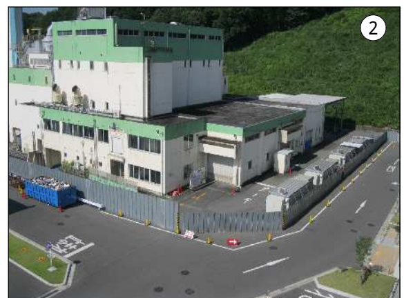
仮囲い、現場事務所等の設置状況