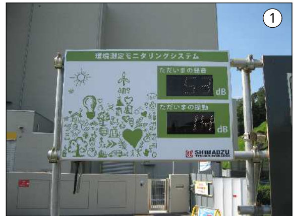
騒音・振動モニタリングの表示