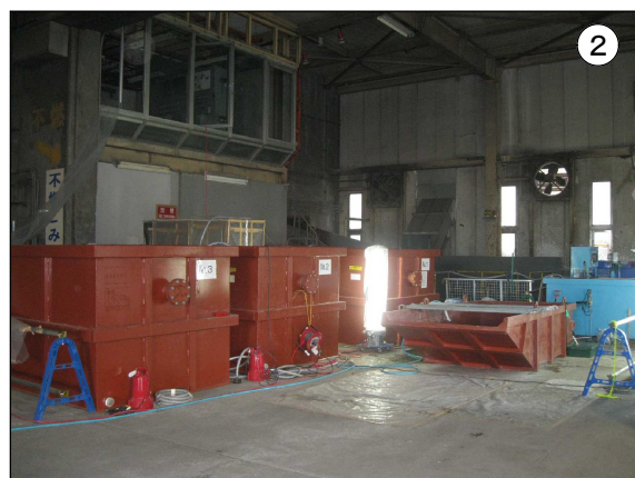
水処理施設の設置状況 (アスベスト除去に使用した水を処理して再利用しています。)