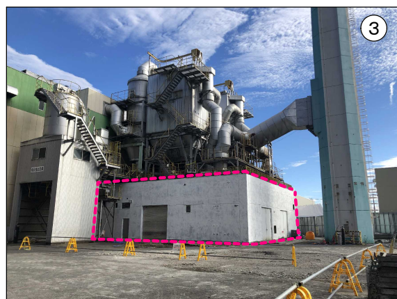
南側1階部分外壁アスベスト含有塗材除去後の状況