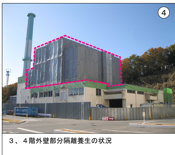
3、4階外壁部分隔離養生の状況