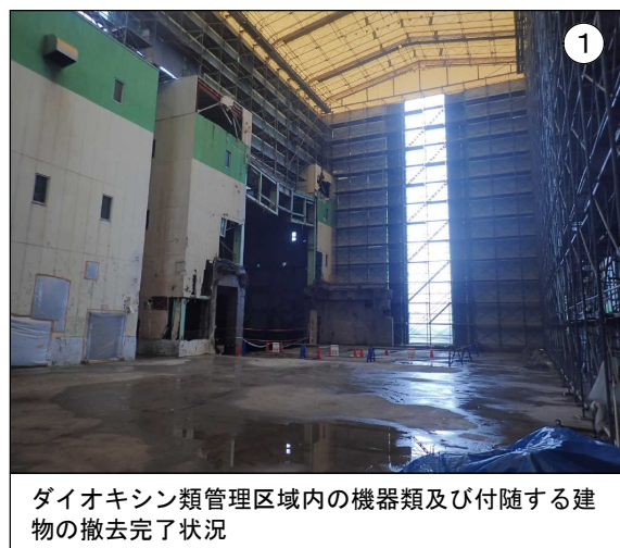
ダイオキシン類管理区域内の機器類及び付随する建物の撤去完了状況