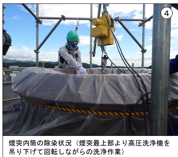
煙突内筒の除染状況（煙突最上部より高圧洗浄機を吊り下げて回転しながらの洗浄作業）