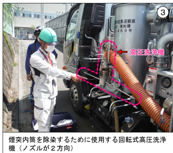
煙突内筒を除染するために使用する回転式高圧洗浄機（ノズルが2方向）