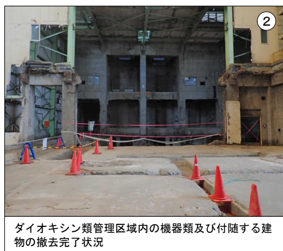
ダイオキシン類管理区域内の機器類及び付随する建物の撤去完了状況