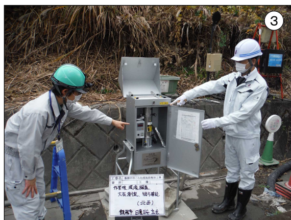
周辺大気環境測定状況