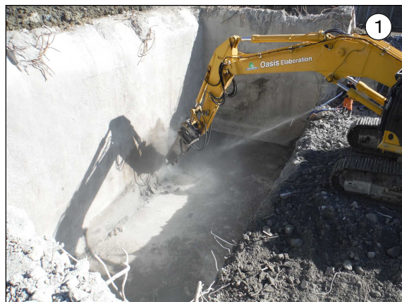
ごみピットの地下部分の解体状況