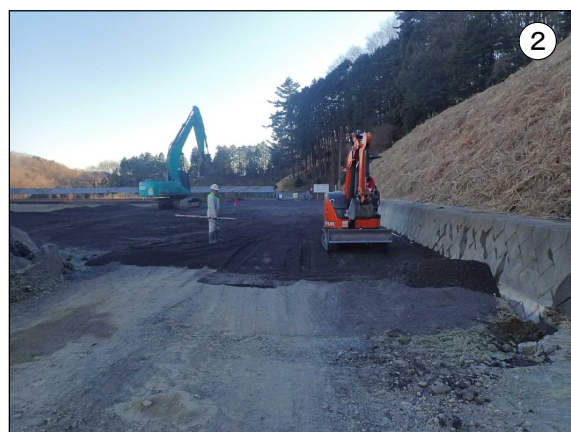
解体エリアの整地状況