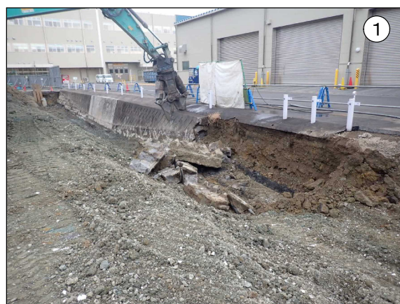
建物周辺の外構の撤去状況