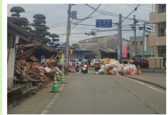
【道路上まではみ出した混合ごみ】