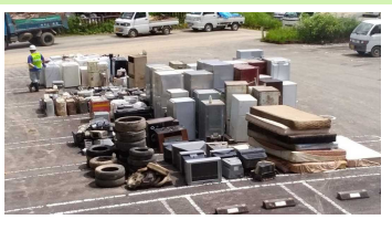
【分別された災害ごみ】

分別により、ごみ処理の手間や費用が減り、また処理期間も短くなり、迅速な復旧に繋がります。