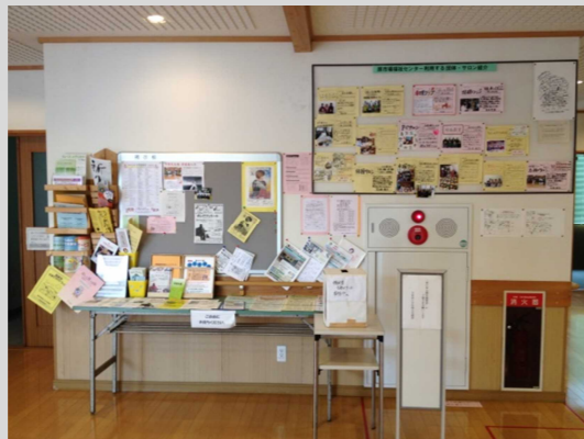
掲示板では活動サークル等や、様々な地域の情報が手に入ります。