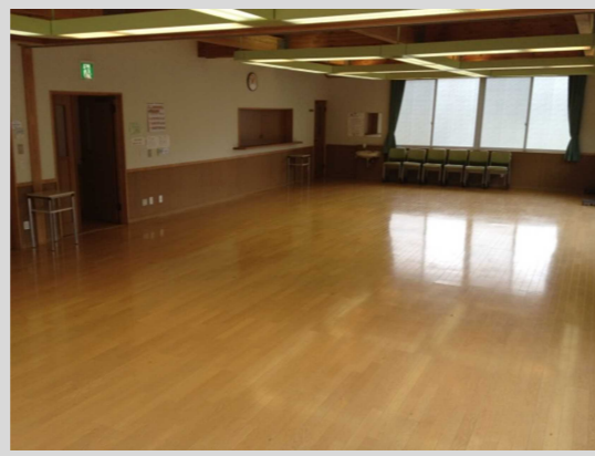
1階研修室と食堂をつなげ、卓球などのスポーツや会議にも利用できます。