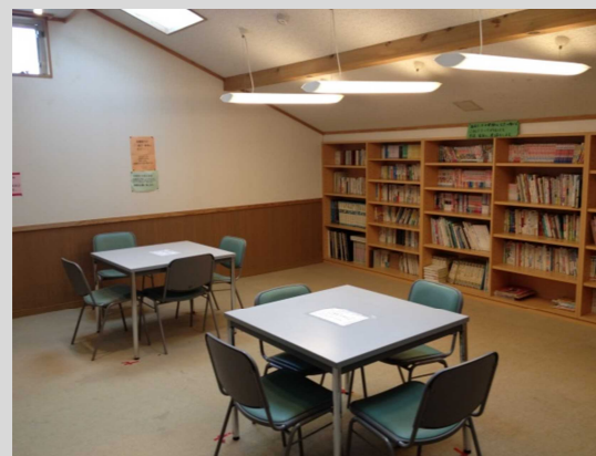
2階の図書室では静かに勉強に取り組めます。