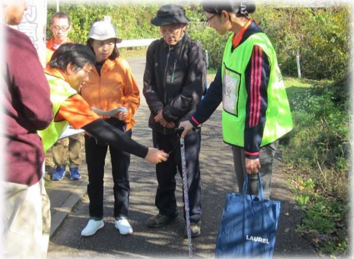
【グループワーク・訓練の振り返り】

訓練を終え、本郷倶楽部に戻り、班ごとにグループワークを行いました。「声かけをしてみてどうだったか」「どこが難しかったか」など、徘徊役を演じた地域包括支援センターの職員や作業療法士の方も混ざりながら、声かけを実際に体験した感想を共有しました。グループワークが終わった後には、何名かに発表をしていただき、全体での感想の共有もしました。日頃から、近所の方にあいさつをすることが大事という感想をいただきました。