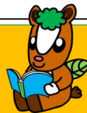
飯能市イメージキャラクター 夢馬（むーま）

電話：972-2114（火～金9：30～19：00、土日祝9：30～18：00）