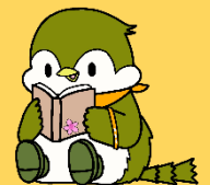
飯能市認知症地域支援推進員 キャラクター ひだまりちゃん

電話：972-2114（火～金9：30～19：00、土日祝9：30～18：00）