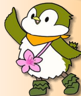
「ひだまりちゃん」 飯能市認知症地域支援推進員キャラクター