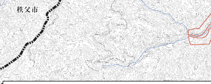
飯能市洪水ハザードマップに使用した「荒川水系入間川流域洪水水害想定区域図-水害リスク情報図(想定最大規模)」の算出の前提となる降雨は、入間川流域の3日間総降雨740mmです。

凡例 ● 使用可能 ● 2階以上使用可 ● 使用不可 ※指定緊急避難場所としての指定している施設については、指定避難所欄は(—)で表示しています。 ※台風や大雨により、土砂災害が発生する可能性がありますので、市が発行した「飯能市土砂災害ハザードマップ」を参考にして、災害に備えましょう。