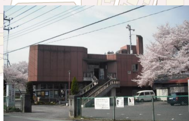
加治地区行政センター