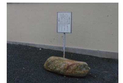
笠縫の力石(ちからいし)

この石は、往時の若者が力だめしの競技に用いられたという石で「力石」と呼ばれている。石の重量 100キログラム