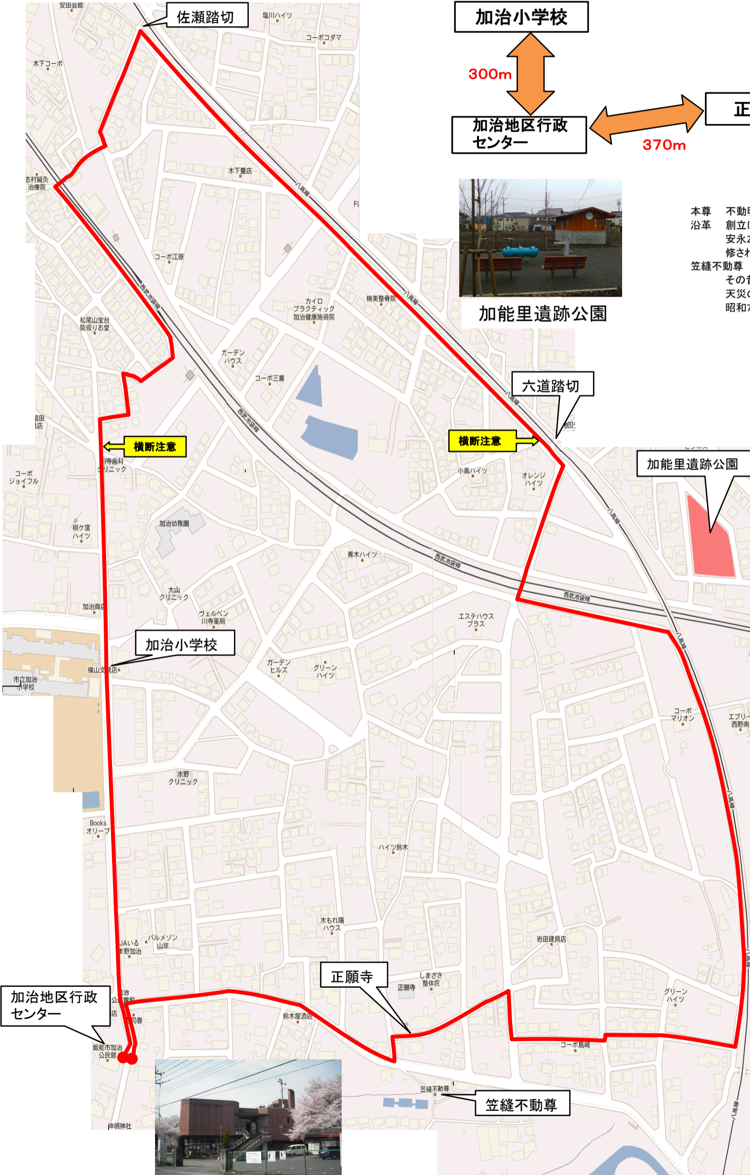
加治地区行政センター