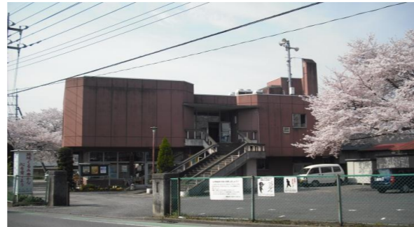
加治地区行政センター