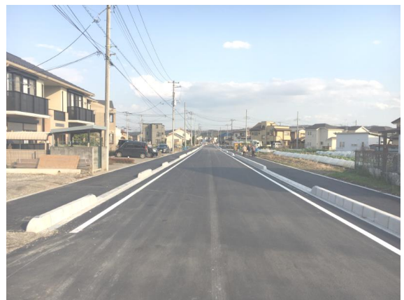
📷 ② 川寺岩沢線実施状況

●川寺岩沢線の一部区間の整備が完了しました。来年度も引き続き、加治小学校方面への整備を進めます。歩道ができることにより、児童・生徒及び歩行者等が安全安心に通行できるようになります。