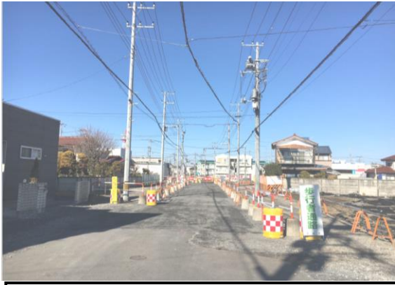
📷 ① 26街区造成ほか実施状況