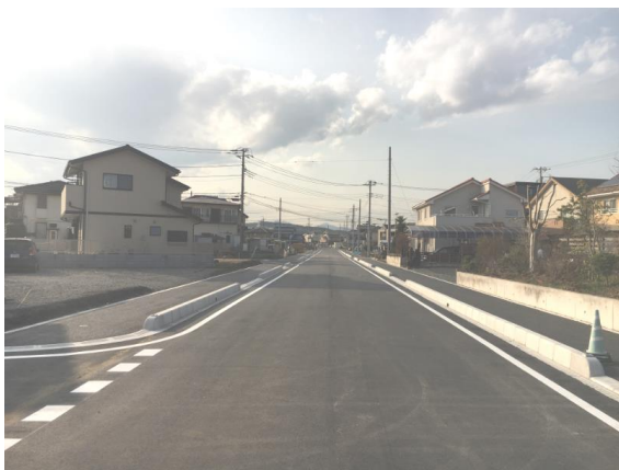
📷 ① 川寺岩沢線実施状況