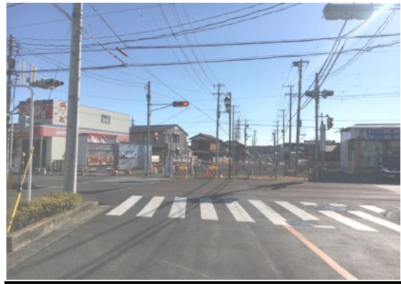
📷 ② 26街区造成ほか実施状況

●双柳岩沢線及び国道 299 号が交差する市役所入口交差点の整備を進めています。 当該交差点は、国道 299 号の南側を拡幅する計画となっており、現在、沿道の建物移転等を実施しています。なお、双柳岩沢線の岩沢白鬚神社北側から富士見通り方面への開通については、平成 32（2020）年度末を予定しています。