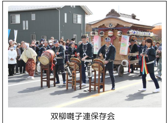
双柳囃子連保存会