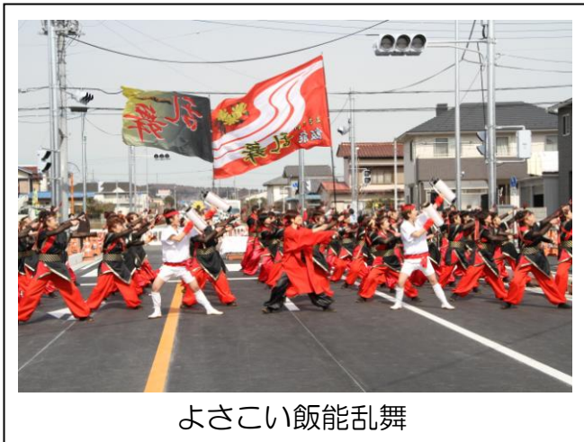
よさこい飯能乱舞