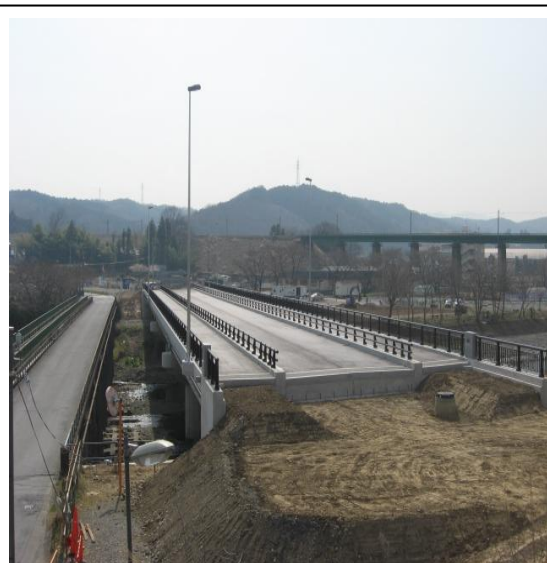
岩沢側から阿須方面を望む

阿岩橋の整備については、おかげさまで橋の本体に係る工事が完成しました。24年度からは、橋の取り付け道路の整備を中心に工事を行う予定です。工事期間中は、歩行者や車両の通行に大変ご不便をお掛けしますが、皆さまには、引き続きご理解、ご協力をお願いいたします。