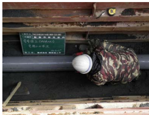
下水道管の布設工事の様子