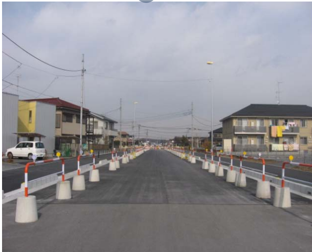
阿須小久保線の状況