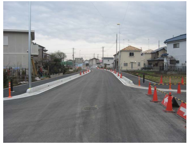
東原巽原線の状況