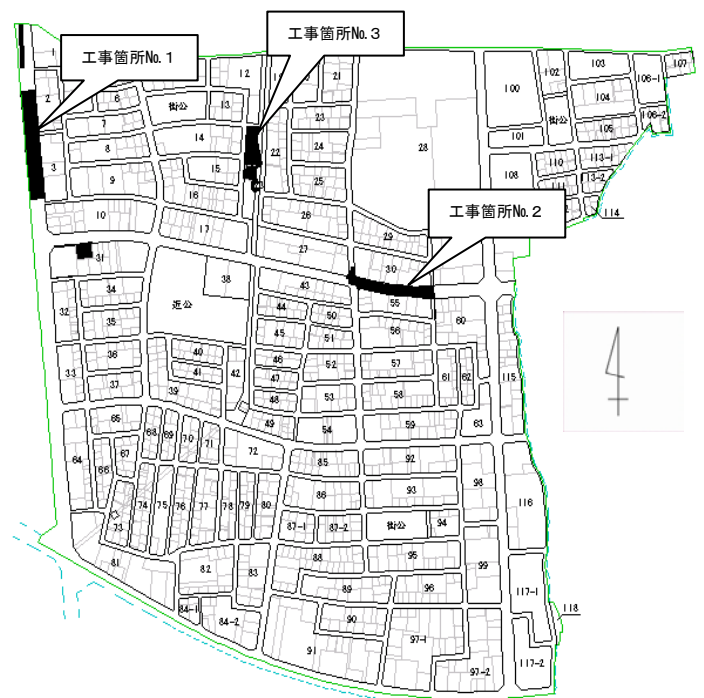
【双柳南部地区工事実施箇所図】

また、地区内の中央を東西に通過する東原巽原線につきましては、約100mを整備いたしました(工事箇所No.2)。この道路につきましては、道路下に浸透機能を備えた雨水管