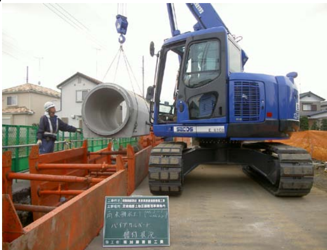
雨水管の設置状況（東原巽原線）