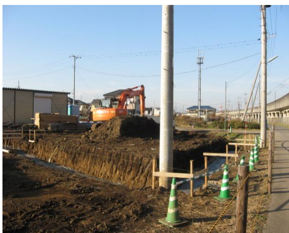
136街区宅地造成の工事状況