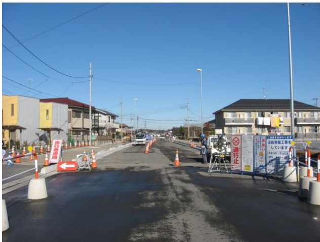
都市計画道路 阿須小久保線の工事状況