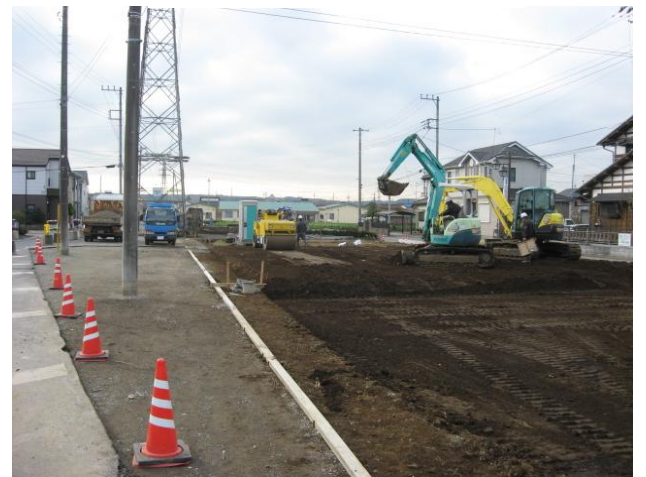
18街区宅地造成工事の状況