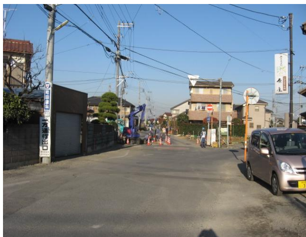
六道踏切北側の工事状況