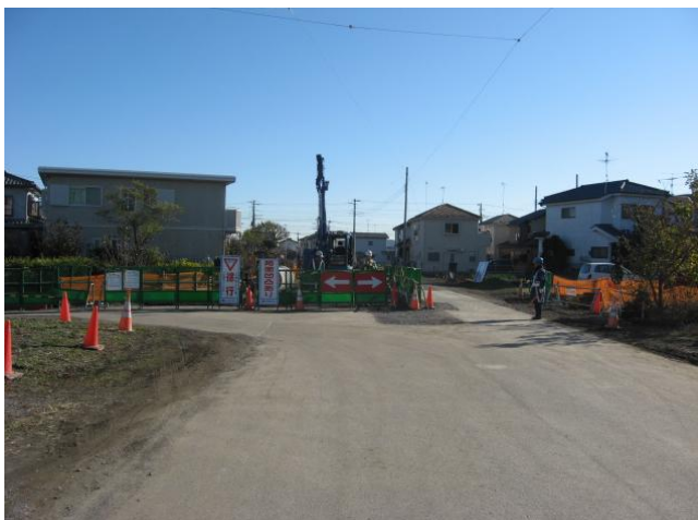
都市計画道路 東原巽原線の工事状況