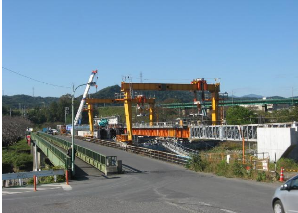
(岩沢側より阿須方面を望む)

阿岩橋の架替え工事につきまして、下部工（橋脚2基、橋台2基）が平成22年度末に完成いたしました。上部工の工事については、7月に工場での製作を終え、10月から架設桁架設工法により右岸側（阿須側）より順次、架設を行い、来年3月の完成を予定しています。