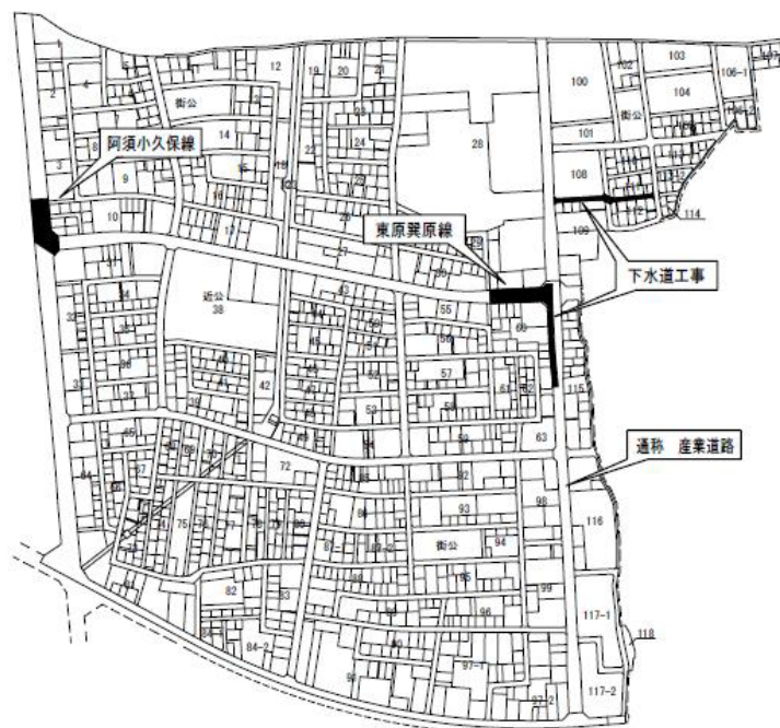
【双柳南部地区工事実施箇所図】

東原巽原線から北に向かう阿須小久保線の約50mについて整備をしています。歩道整備にあたり、隣接している皆様のご協力に厚くお礼申し上げます。