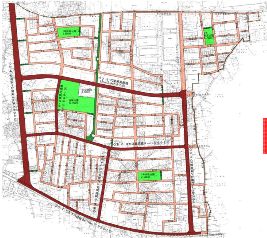
【 現 計 画 】