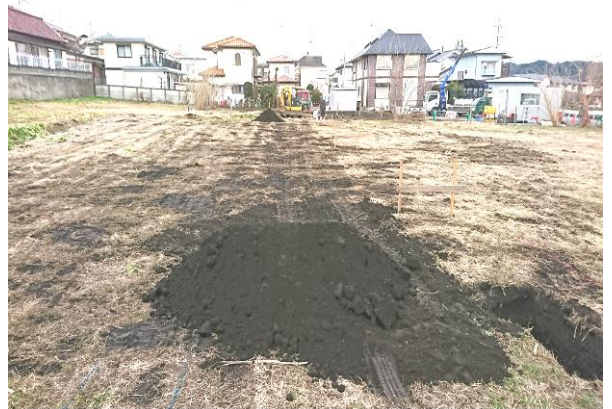
④ 区 4-119 号線実施状況