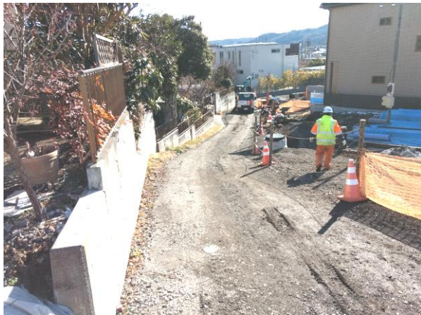
⑦ 市道 1-2597 号線実施状況