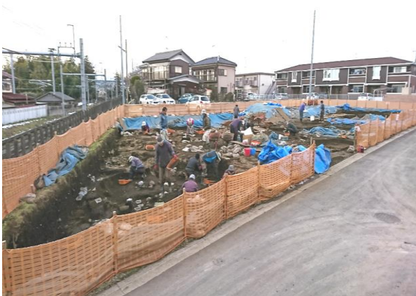
⑤ 405 街区実施状況