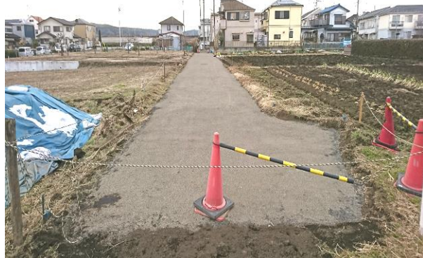
⑩ 区 4-5 号線実施状況