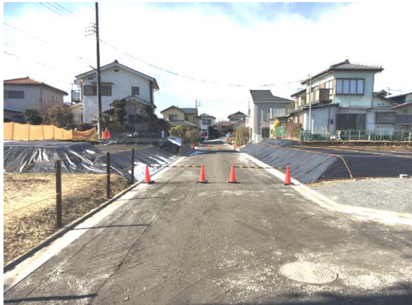
① 区 6-101 号線実施状況