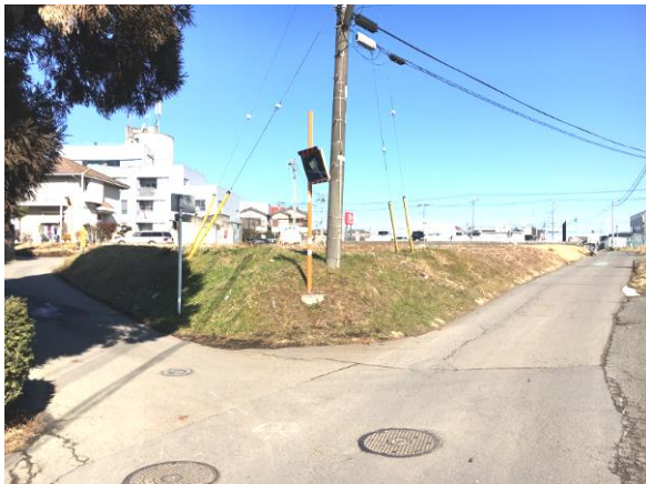
③ 区 4-115 号線実施状況