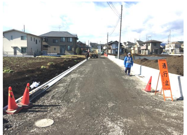
② 20 街区実施状況