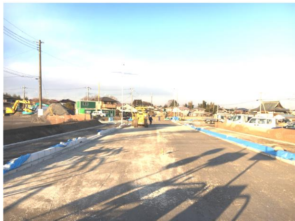
⑧ 阿須小久保線実施状況