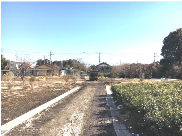
⑪ 区 4-22 号線実施状況