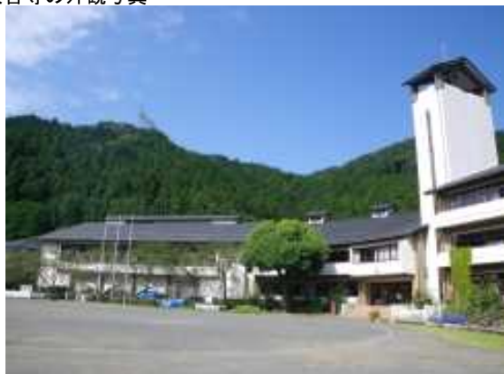
校舎等の外観写真