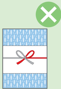
お歳暮・お年賀など