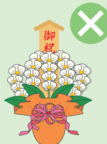
落成式・開店祝などの祝花、葬儀の供花、病気見舞いなど