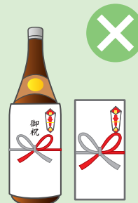
お祭りへの寄附・差し入れ、町内会の集会・旅行などの催物への寸志・飲食物の差し入れ

※政治家本人が結婚披露宴、葬式などに自ら出席してその場で行う場合には、罰則が適用されない場合があります。