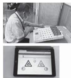
あさひやまライフネット「脳トレ」 ふれあいサロン笠縫

新・放課後子ども総合プラン 保育のあり方検討・農業振興 フレイル予防・道の駅について