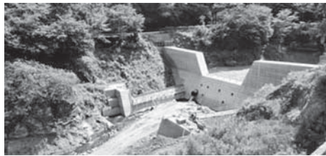
工事中の有間ダム貯砂堰堤

埼玉県によると、上流からダム湖に流入し堆積した土砂を掘削し除去するための工事、浚渫船によりダム湖水面下の堆積土砂を掘削するための工事、上流に貯砂堰堤を設置する工事を実施している。荒川水系治水協定を締結し、ダム流域に48時間当たり450mmを超える降雨が予想される場合、事前放流を検討することとしている。