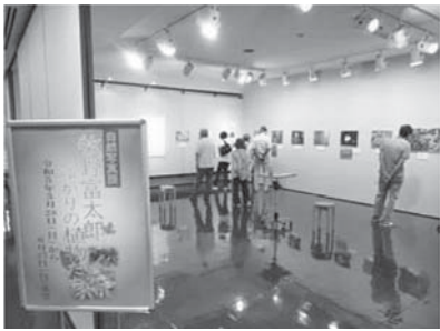
飯能市立博物館きつとす 「牧野富太郎ゆかりの植物たち自然写真展」

障害福祉計画により明確に位置づけを図る。福祉教育を進め、脳梗塞後の方の介護保険サービスに高次脳機能障害の支援を見込む等、地域全体で支える為、地域福祉計画との整合性を図る。