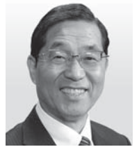
新井 巧 (日本共産党)