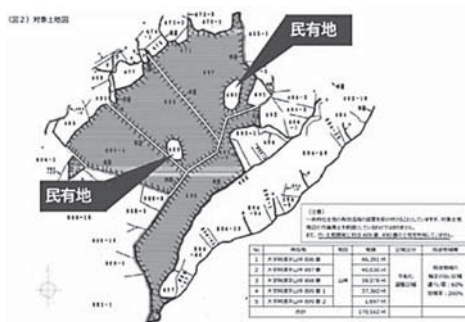
公募地内に囲まれた民有地2筆