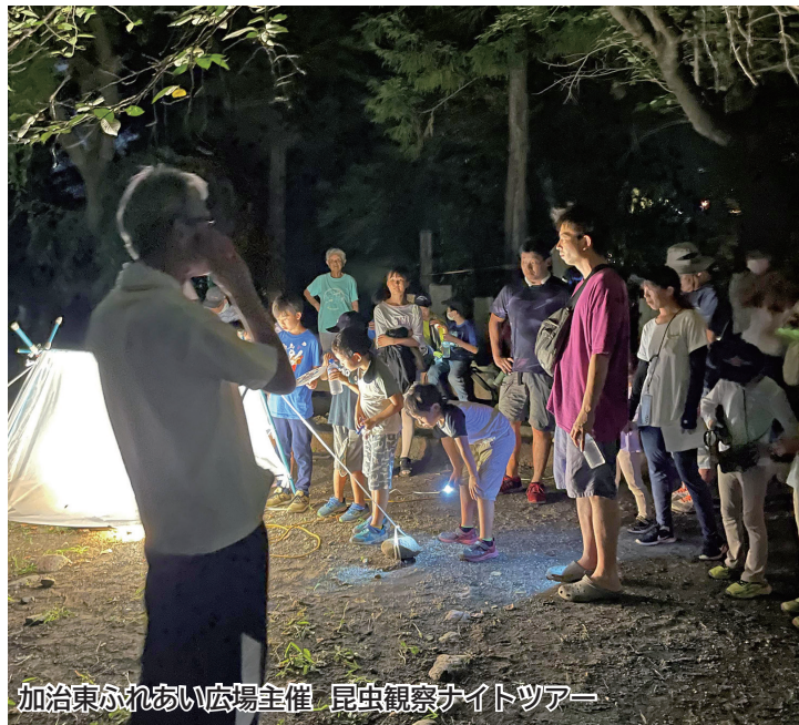
加治東ふれあい広場主催 昆虫観察ナイトツアー