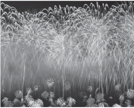
イメージ写真