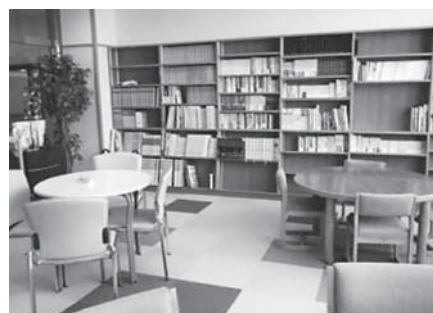
クールオアシス(美杉台地区行政センター図書室) (本人撮影)

答 公共施設では公民館や福祉センターなど12施設が登録されている。容易に利用できるよう分かりやすい表示に努めたい。