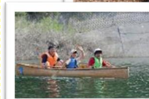
【カヌー体験・クラブ活動】