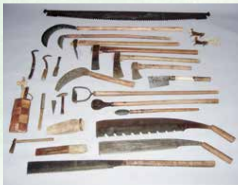
飯能の西川材関係用具の一部

今回ご紹介する「飯能の西川材関係用具」は、計448点が平成19(2007)年に埼玉県有形民俗文化財に指定され