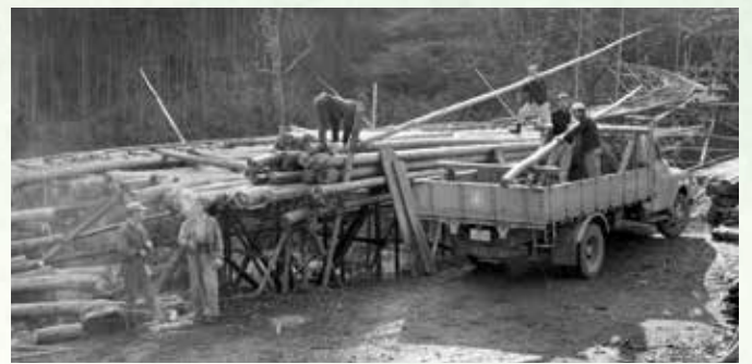
昭和30年代のトラックによる搬出の様子

ケズリヨキ(表紙写真下段左)は伐採した材木を削って、角材をつくるために使われました。熟練者のつくった角材は、並べて置いた上に水をかけても下にこぼれないほど正確な作りであったと言われています。