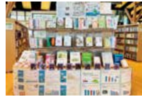
男女共同参画週間展示(令和5年度)の様子