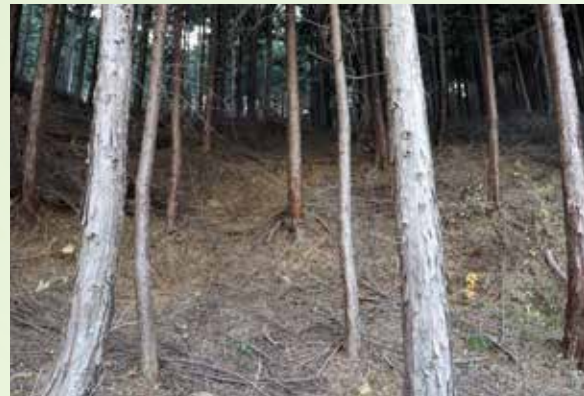
手入れが行き届かなくなった森林

森林に期待されているさまざまな公益的機能（水源かん養機能、山地災害防止機能など）を發揮するためには、適切に管理されていることが重要となります。