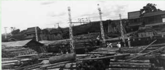
昭和20年代の飯能駅周辺の様子

鉄道や道路が整備される以前は、伐採した材木を筏に組み、川を利用して運搬していました。「西川材」は、「江戸の西の川から流されてくる木材」を指してその呼び名が付いたと言われています。「西川」ということばは天保10(1839)年の古文書には既に登場していて、明治時代以降にこの名が広まりました。西川材は、古くから木材の産地である現在の飯能市周辺の林業の発展を支えてきました。こうした西川材を産出する林業は「西川林業」と言います。