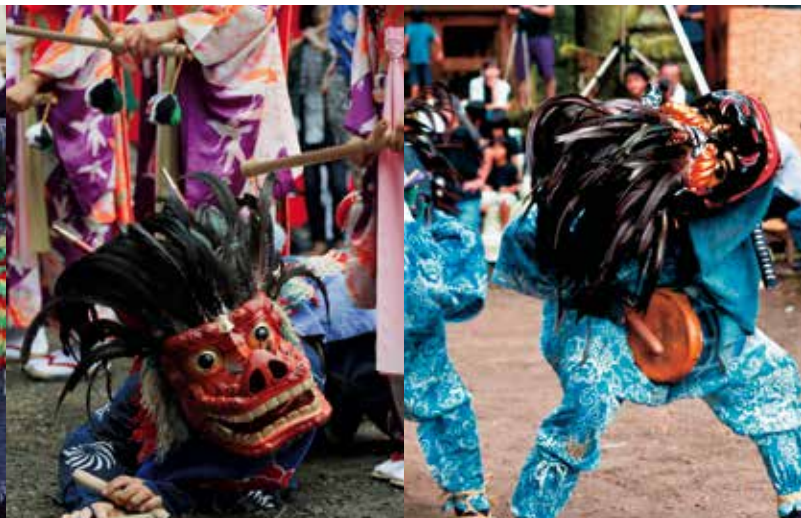
星宮・諏訪神社の獅子舞