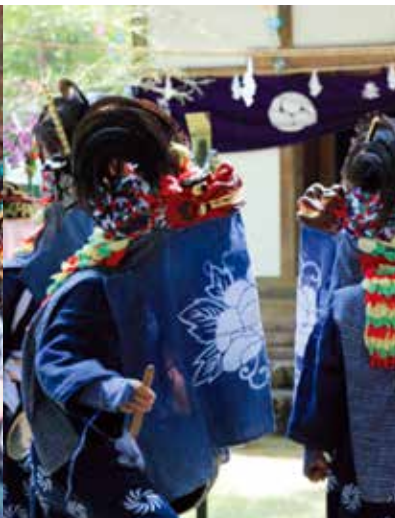
檜渚諏訪神社の獅子舞