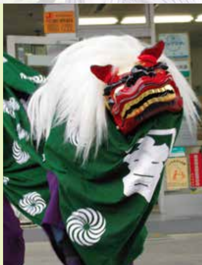
石原の大神楽獅子舞