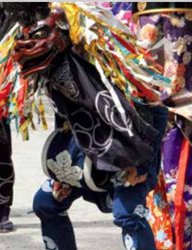
飯能諏訪八幡神社の獅子舞