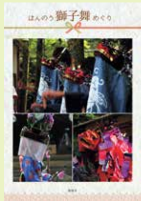
はんのう獅子舞めぐり

埼玉県指定無形民俗文化財 および飯能市指定無形民俗 文化財の飯能市内の獅子舞 飯能市内の獅子舞の各地の 様子【表紙写真】 詳細については、「はんのう 獅子舞めぐり」(市役所、博 物館、図書館などで配布)、 または2ページをご覧ください。