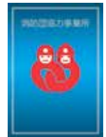
消防団協力 事業所表示証

「飯能市消防団協力事業所表示制度」は、飯能消防団に積極的に協力している事業所等を「消防団協力事業所」として認定し、「消防団協力事業所表示証」を交付することにより、消防団と事業所等との連携・協力体制の強化を図り、地域の防災力の充実強化に資するものです。詳細は、防災危機管理室へ問い合わせてください。