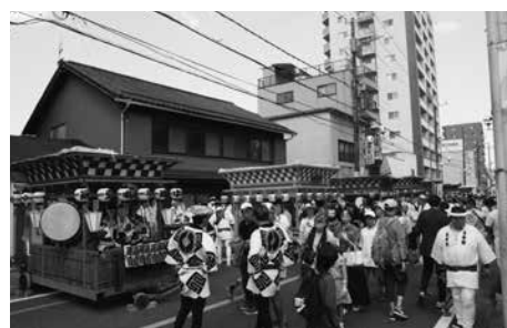
飯能夏祭り(令和5年)の底抜け屋台総覧の様子

つの自治体内に多くの「底抜け屋台行事」が残されていることは大変貴重なことと言えます。この貴重な行事を長く保存し、後世へと伝えていくため、このたび飯能市指定無形民俗文化財に指定をしました。指定の対象は、一丁目・二丁目・三丁目・河原町・宮本町・原町・前田・柳原・中山・双柳・本郷・浅間・平松の各団体の底抜け屋台行事です。