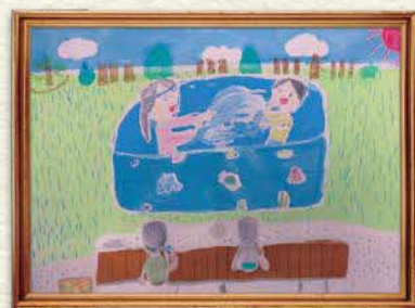
【家族で楽しい思い出づくり】