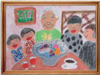
【ハッピーバースデー じいちゃん】