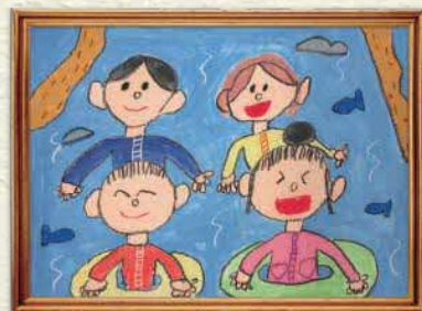
【かぞくみんなであそぶとたのしいな】