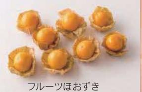
フルーツほおずき

申し込み はがきに氏名、住所、電話番号を明記のうえ、1月25日(月)までに「〒357-8501 飯能市販わい創出課高萩市プレゼント係」へ(当日消印有効) ※当選結果は、品物の発送をもって替えさせていただきます。