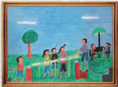
【おばあちゃんちで流しソーメン】