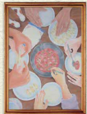
【日曜日はみんなで】