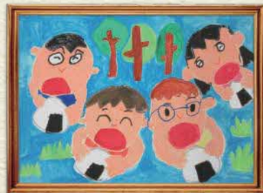
【かぞくて おにぎり おいしいね】