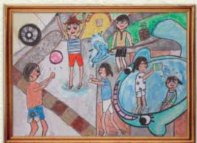
【家族と庭で水遊び】