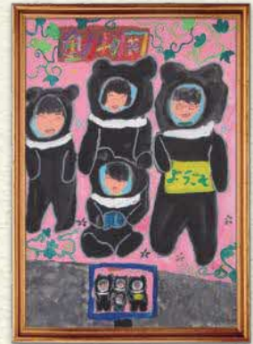
【動物園でハイ!チーズ!!!】