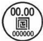
基準適合証印シール

交換工事 市指定給水装置工事業者が交換します。作業を行うため、 メーターボックスの上には物を置かないでください。