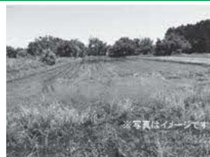
精明地区の畑でオクラ種蒔きや行政センターでうどん打ち体験を楽しむツアーです。