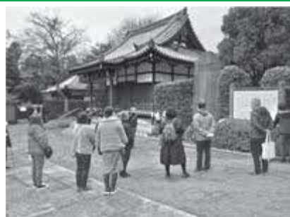
博物館や能仁寺、街中で飯能の歴史について学ぶツアーです。