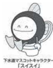
下水道マスクキャラクター「スイスイ」

公共下水道にマスク・布・油類などを流すと下水道管のつまりや故障の原因になります。次のことに特に注意して、決められた分別方法で処分してください。