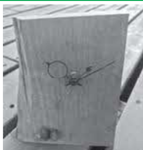
地元優良材である西川材について学び、製材所で木の香りに癒されるツアーです。