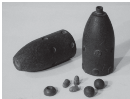
双木家の茶の間に撃ち込まれた砲弾 個人蔵

の弾とともに記録し後世に伝えておくこととした。ここにやってきた旧幕府方は振武軍で、上野では彰義隊が戦ったがいずれも大敗を喫し、その他諸国で戦っていた旧幕府方はいずれも焼き討ちにあった。後世に恐ろしいことと記憶されるのできごとのあらましを書き置いた。