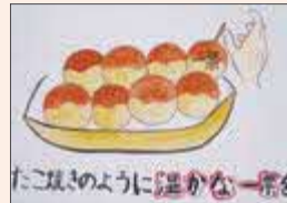
せきかん な 関相奈 (富士見小6年)