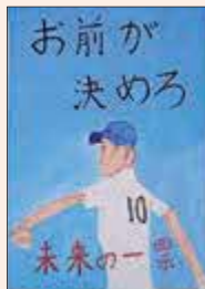
にしじまろうし 西島颯志 (富士見小6年)