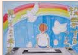
おかべさき 岡部咲希 (富士見小6年)