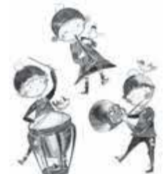
イラスト:松枝晶子氏

※入場には整理券が必要です。整理券は1月5日(水) 9:00から市民会館で配布します。