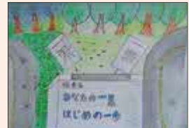
やまぐちまさる 山口葵羽 (富士見小6年)