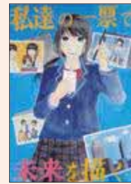
かんださやか 神田清華 (飯能第一中2年)