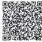
小規模工事 電子申請用

※申請書等は、飯能市ホームページからダウンロードできます。 ※技術者資格等を要する工事を希望する場合は資格証等の写しの添付が必要です(電子申請の場合は画像データを添付)。