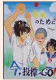
かとうあんな 加藤杏奈 (飯能西中1年)