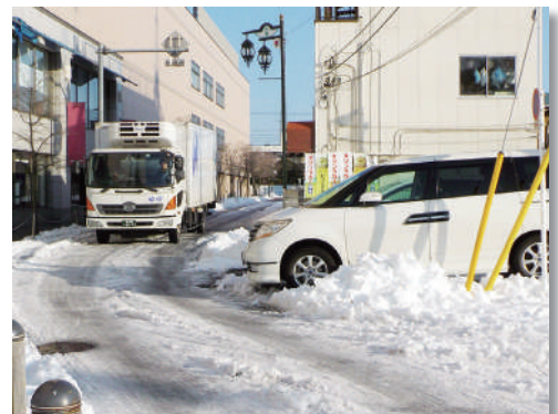
市街地での降雪状況

問い合わせ 危機管理室 TEL973-2723 FAX972-8455 ✉kikikanri@city.hanno.lg.jp