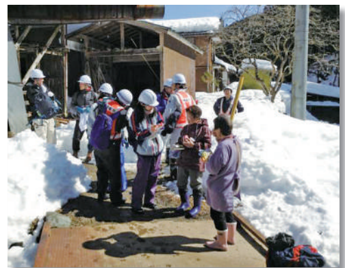
大字南での住民の安否確認

平成26年2月に降った大雪は、気象観測史上最大の積雪を記録。除雪活動の難航等により、山間部では孤立や停電が解消するまでに数日を要し、日常生活に大きな被害と影響を与えました。今後再び大雪が降った際に、被害や影響を最小限にとどめるため、できる限りの備えと心構えをしておきましょう。