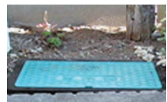
メーターボックス