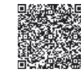
飯能市ホームページ