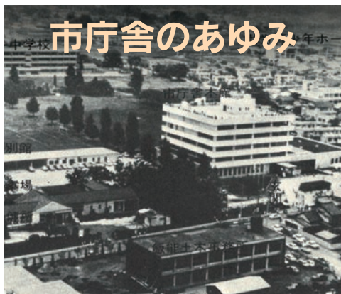
昭和47年の現市役所周辺の様子

現在の飯能市役所本庁舎は、昭和47年(1972年)5月20日に落成記念式典を行い、5月29日に業務を開始しました。