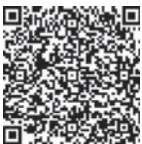
飯能市ホームページ