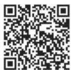
メール登録はこちらから